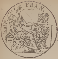
Table alphabétique des actes de naissance de la Mairie de Willeby dressée en exécution Du Décret impérial du 20 juillet 1807. pour l'an 1808.