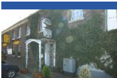
Hotel Alt Stocks

Alle Zimmer mit Dusche und WC, Fernsehen und Arbeitsplatz. Chinarestaurant mit Biergarten Kostenlose Parkplätze am Haus