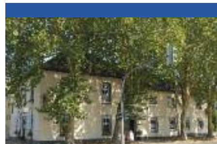
Hotel Zum Schwarzen Pfuhl

Einzelzimmer 35 € ohne Frühstück Doppelzimmer 55 € ohne Frühstück Frühstück 6 € pro Person