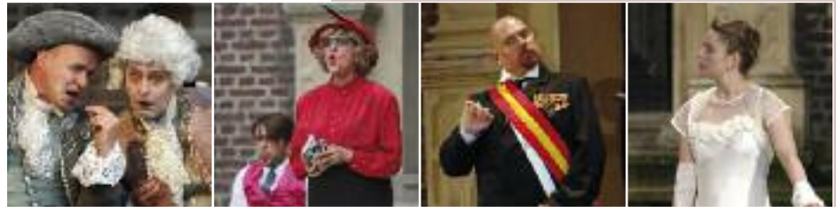
Impressionen der Spielzeiten 2008 und 2009.