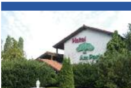
Hotel am Park

Einzelzimmer ab 60 € inklusive Frühstück Doppelzimmer ab 85 € inklusive Frühstück