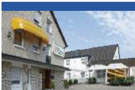
Hotel Garni Hamacher