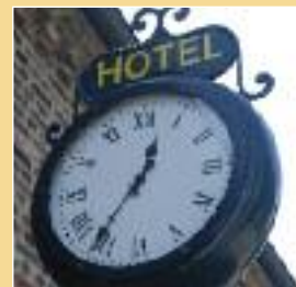
Landhotel Claashof in Willich