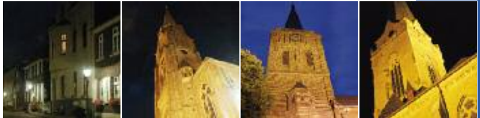
Willich – eine Stadt – vier Stadtteile

Willich ist eine moderne Stadt mit Zukunft, aber auch voller Geschichte: Vier bis 1970 selbständige und bis zu 1000 Jahre alte Gemeinden, die Ortsteile Willich, Anrath, Schiefbahn und Neersen, bilden heute die Stadt. Eine Stadt, in der es sich gut arbeiten, aber wegen der wirklich kompletten Infrastruktur auch schön leben lässt.