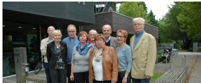
Die stimmberechtigten Mitglieder des Seniorenbeirates, v.l.n.r.: