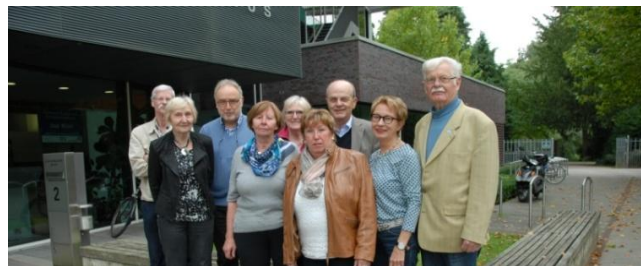
Die stimmberechtigten Mitglieder des Seniorenbeirates, v.l.n.r.: